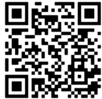
11 / 05 高一自主 微課程報名表