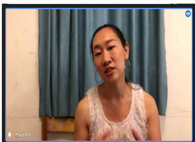
10.1 性別平等週會講座：日暮之前的領悟、再見全壘打(線上講座)