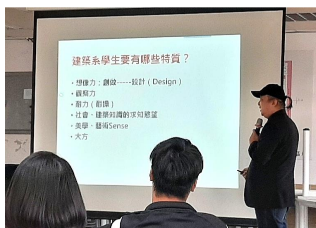
11.11 職場達人講座：建築師