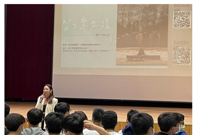
11.19 生命教育週會講座：選修一堂人生的冒險學分