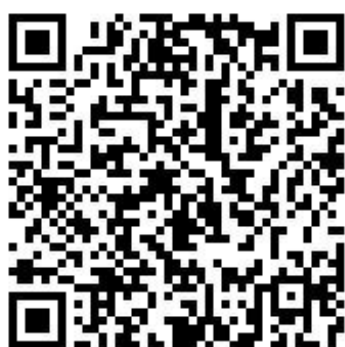
←午餐補助 QR code

一、學生於提出請假申請後應自行注意是否通過審核，權責人員不另行通知。請假申請退回是因為未完成請假，學生應於退回日起 5 日內進行補正並重新申請。