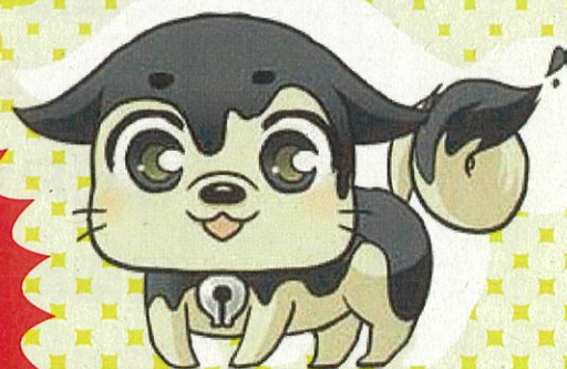
漫畫甲子園官方吉祥物: Beta

https://mangaoukoku-tosa.jp/manga-koshien/35/