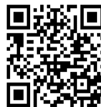
風險管理與保險教育推廣入口網

https://rm.ib.gov.tw/Pages/FKLearning_new.aspx