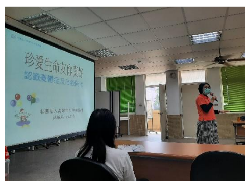
12.10 輔導股長心理健康講座