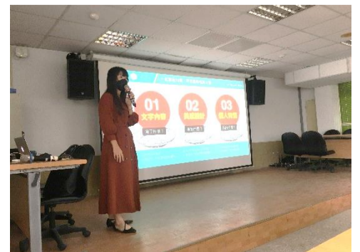
12.21 學習歷程檔案製作講座