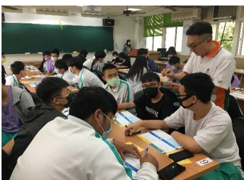
12.4 科技 in life 生涯探索活動