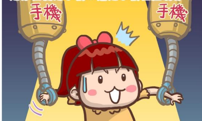
寧可傳訊息勝過面對面溝通