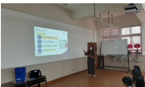
3.26 職場達人講座:研發工程師