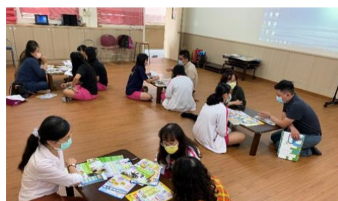
3.9 科大招生宣導講座(共 6 場)