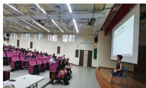
4.1 面試技巧說明講座