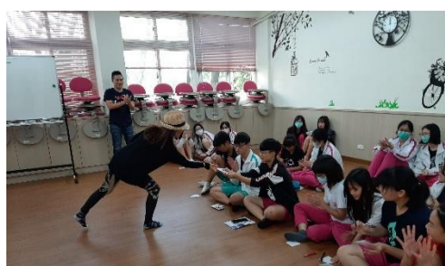
3.26 職場達人講座:畫家