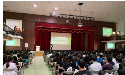
3.19 職場變化與就業趨勢講座